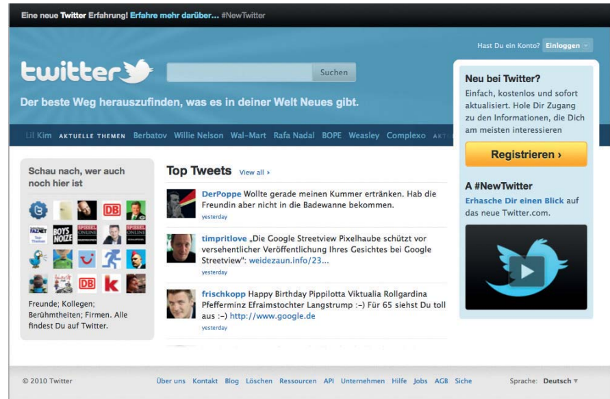
Die Twitter-Homepage: Also darüber spricht das Netz ...?

fangen bei www.twitter.com . Im fast bajuwarischen Weiß-Blau präsentierte sich mir erstmalig der hochgelobte Kurznachrichtendienst.