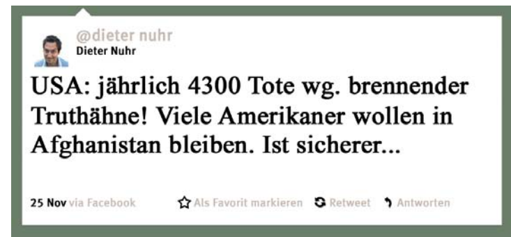
Der Comedian Dieter Nuhr gehört zu den beliebtesten deutschen Twitterern.

Wenn auch etwas zögerlich, so geht der Trend bei den deutschen Stars doch so langsam zum eigenen Twitter-Profil. Bleiben wir also dran und freuen wir uns auf zukünftige Schlammschlachten. Vielleicht werden ja sogar nette Vorzeige-Promis wie Kai Pflaume oder Michelle Hunziker noch mal richtig zickig.