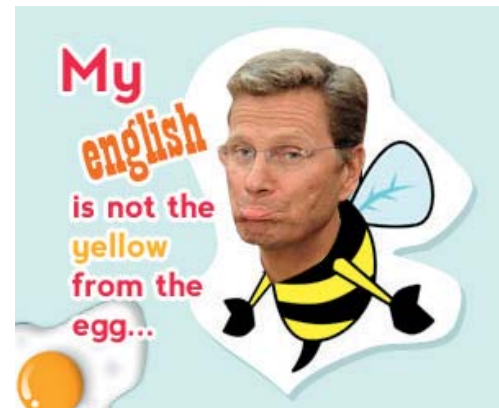
Das wenig schmeichelhafte Profelfoto von @Westerwave.

Da muss man schon ganz schön lange rätseln, um dieses Englisch in einen sinnvollen deutschen Satz zu übersetzen. Hier lautet er: „Richtigstellung: Das Heißluftgerät mit einer Rede von mir ist nicht über den FDP-Shop bestellbar. Diese Nachricht ist nur heiße Luft.“