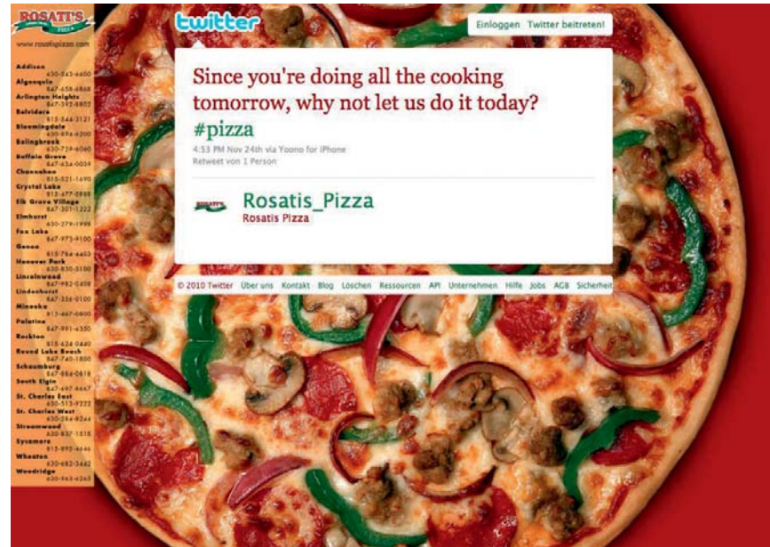
Das Twitter-Profil eines Chicagoer Lieferservices macht Appetit. Ob wohl auch in Deutschland die Pizzabestellung bald nur noch 140 Zeichen lang ist?

So wie mir geht es vielen. Zwar ist Twitter, was offizielle Zahlen angeht, nicht immer sehr Gesprächig, aber eine nicht gerade kleine Zahl steht im Raum: Anscheinend gibt es über 200 Mio. Nutzer weltweit. Wäre Twitter ein Land, hätte es fast so viele Einwohner wie Deutschland, Frankreich und Großbritannien zusammen! 70.000 Anwendungen stehen diesen vielen Nutzern zur Verfügung, die das Gewitscher in jeder Situation ermöglichen: von der Twitter-Homepage, per Handy, iPad oder Smartphone. Sogar eine Art eigener Twitter-Slang ist entstanden, um die Begrenzung auf 140 Zeichen optimal auszunutzen. Schließlich haben Twitterer in der Regel ziemlich viel zu sagen.