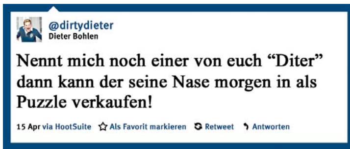
Dieter Bohlen zeigt sich auch auf Twitter in bekannter Form.

Nur auf Dieter Bohlen ist Verlass: Als @dirtydieter twittert er in altbekannter Rotz-Manier und liefert etwas Stoff für 140 Zeichen lange Skandale.